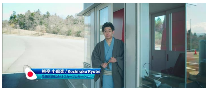
ナレーション: 柳亭小痴楽さん