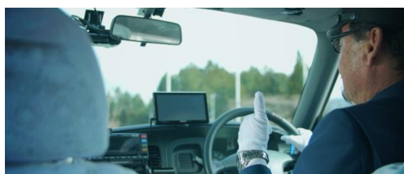
タクシードライバー