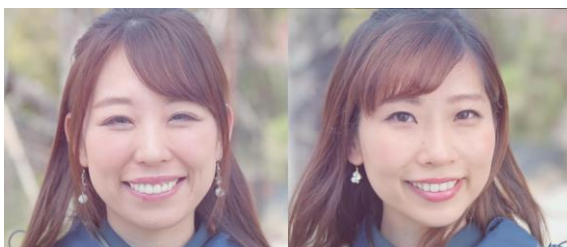
チームのホスピタリティスタッフ『象印コメーズ』 (象印マホービン)