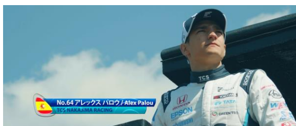
アレックス・パロウ (Alex Palou) 選手