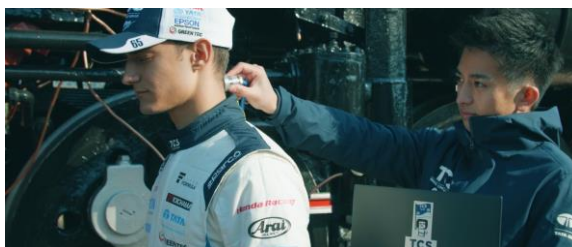
チームのテクノロジーパートナーTCS のエンジニア

なお、6 月末、SUPER FORMULA 第 3 戦(スポーツランド SUGO)の終了後に、本編のメイキング映像の公開およびクイズキャンペーンの実施も予定しています。