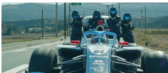
TCS NAKAJIMA RACING のピットクルー